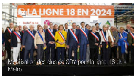
Mobilisation des élus de SQY pour la ligne 18 du Métro.