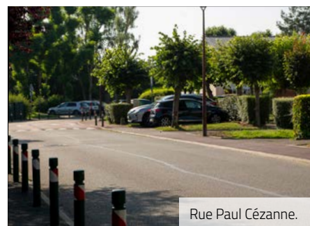
Rue Paul Cézanne.