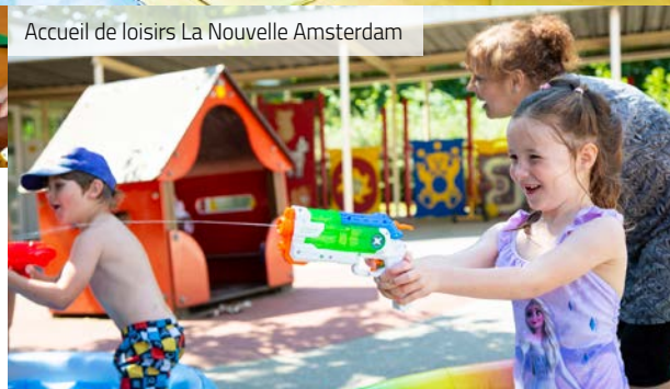
Accueil de loisirs La Nouvelle Amsterdam