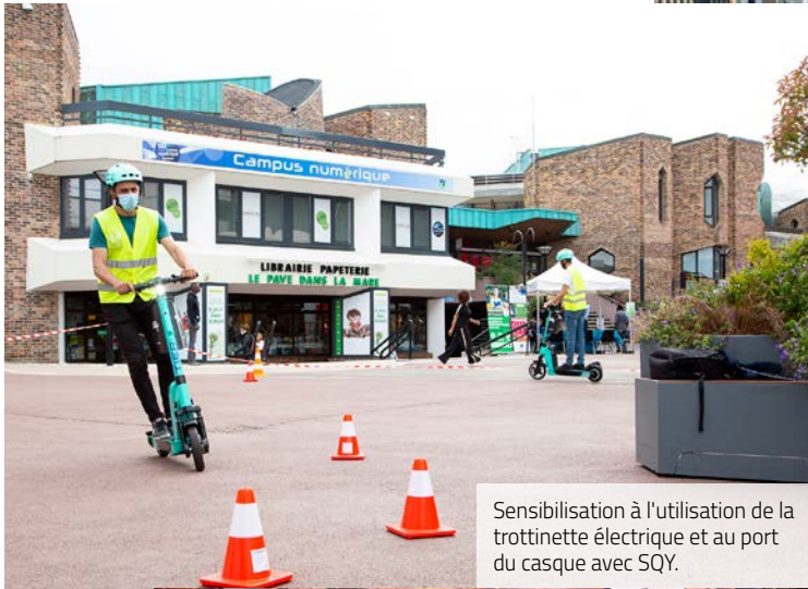
Sensibilisation à l'utilisation de la trottinette électrique et au port du casque avec SQY.