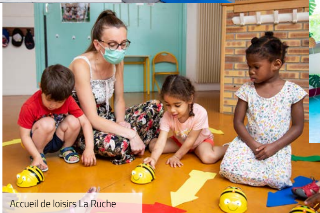
Accueil de loisirs La Ruche