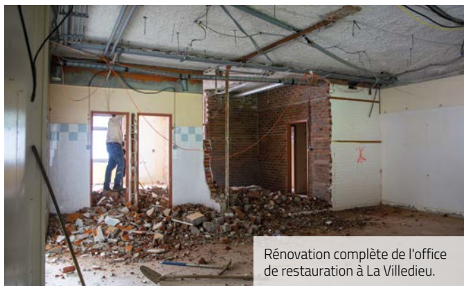
Rénovation complète de l'office de restauration à La Villedieu.

Cet été, la part d'investissement consacrée aux écoles a été répartie sur 4 bâtiments scolaires avec des rénovations conséquentes. Deux chantiers sont toujours d'actualité sur le secteur de la Villedieu-Commanderie.