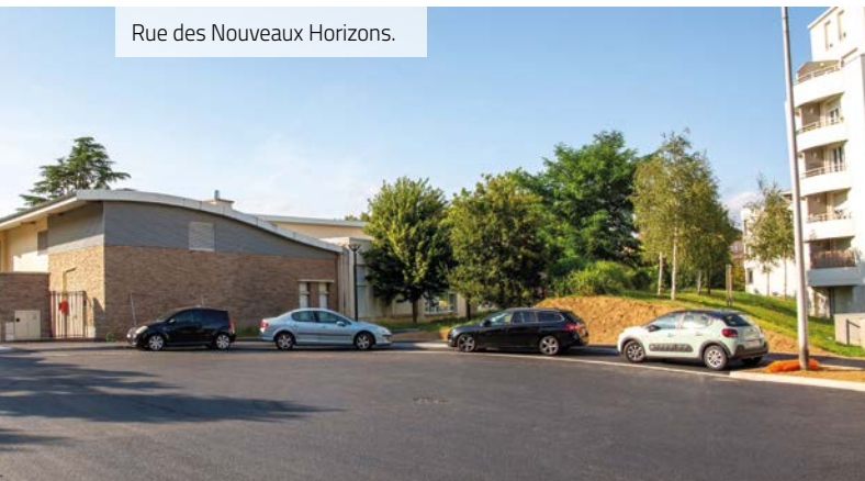
Rue des Nouveaux Horizons.