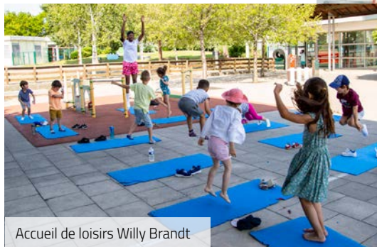
Accueil de loisirs Willy Brandt

Cette année encore, les enfants ont participé à de nombreuses animations dans nos différents accueils de loisirs et passé un super été entre copains !