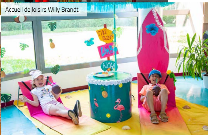
Accueil de loisirs Willy Brandt