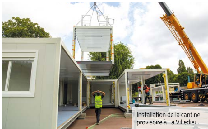
Installation de la cantine provisoire à La Villedieu.