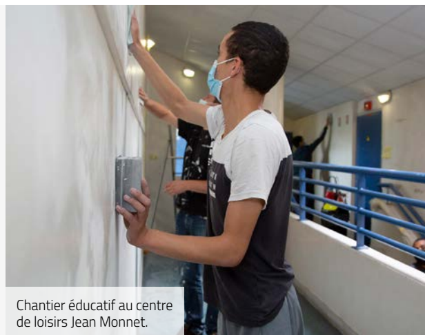
Chantier éducatif au centre de loisirs Jean Monnet.

Cet été, sur l'ensemble des écoles de la Ville, les agents de la Direction du Patrimoine ont réalisé des travaux courants de rénovation et d'entretien : électricité, plomberie, peintures, petites menuiseries... Ils ont également encadré des jeunes, dans le cadre des chantiers éducatifs, pour refaire les peintures du centre de loisirs Jean Monnet, avant la rentrée. De nombreuses interventions ont été gérées directement par la Ville sur la période estivale. Comme chaque année, les agents des écoles ont aussi profité de l'été pour effectuer un grand nettoyage du matériel et des mobiliers, particulièrement renforcé cette année encore, compte tenu du contexte sanitaire.