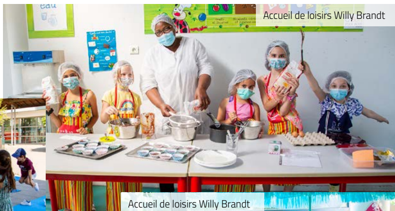
Accueil de loisirs Willy Brandt