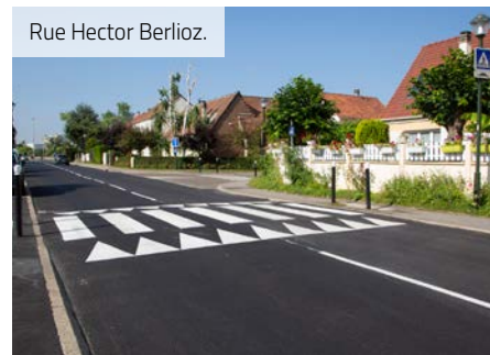
Rue Hector Berlioz.

Le square de l'Amitié a bénéficié d'une réfection totale, afin de recevoir vos enfants dès cet été, pour un montant de 230 000 euros. Il accueille désormais deux toboggans, pour les 1-6 ans et les 2-14 ans, ainsi que deux jeux ressorts pour les 2-8 ans sur le thème des templiers.