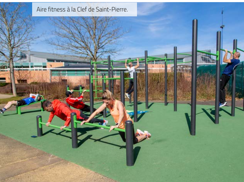
Aire fitness à la Clef de Saint-Pierre.