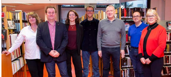
Visite de la médiathèque avec notre Maire et nos élus.