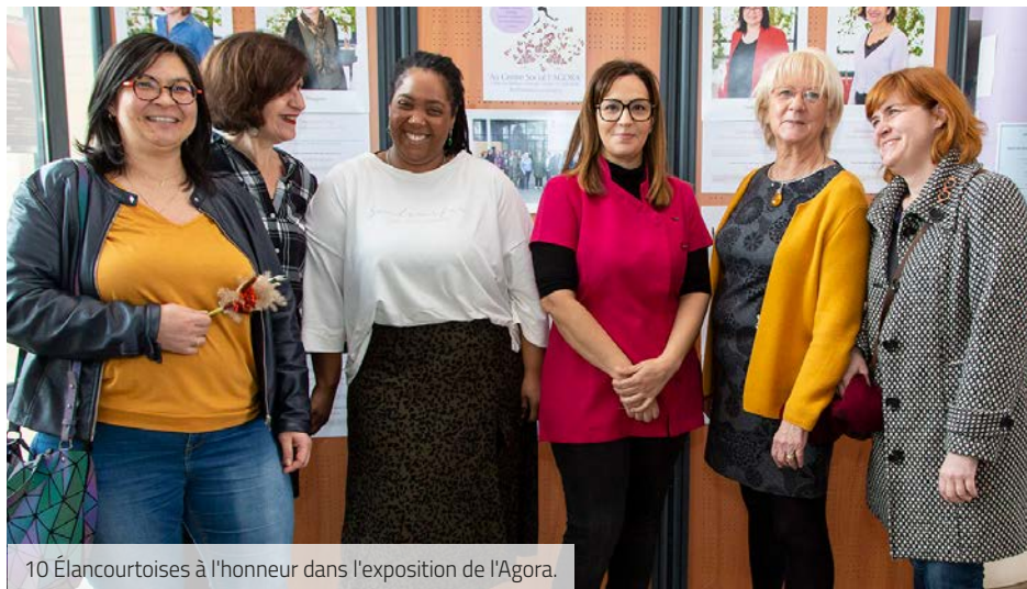
10 Élancourtoises à l'honneur dans l'exposition de l'Agora.