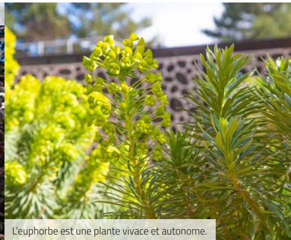
L'euphorbe est une plante vivace et autonome.

Pour répondre aux évolutions climatiques, notre Ville adapte sa gestion des espaces verts. La signature paysagère d'Élancourt évolue au profit d'une végétation résistante et économe en eau.