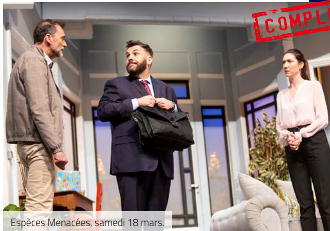
Espèces Menacées, samedi 18 mars.