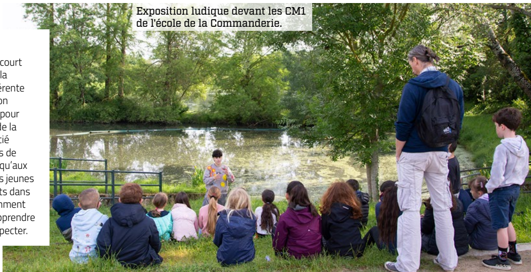
Exposition ludique devant les CM1 de l'école de la Commanderie.

Du 22 au 25 mai, les enfants d'Élancourt étaient invités à célébrer la Fête de la Nature ! À cette occasion, notre référente biodiversité organisait une exposition ludique et une balade pédagogique pour découvrir la biodiversité au Bassin de la Boissière. Cette animation a bénéficié aux scolaires et enfants des accueils de loisirs, de niveau élémentaire, ainsi qu'aux familles ! Elle a ainsi permis aux plus jeunes d'observer les écosystèmes présents dans notre « ville à la campagne », notamment les libellules et demoiselles, pour apprendre à mieux les comprendre et à les respecter.