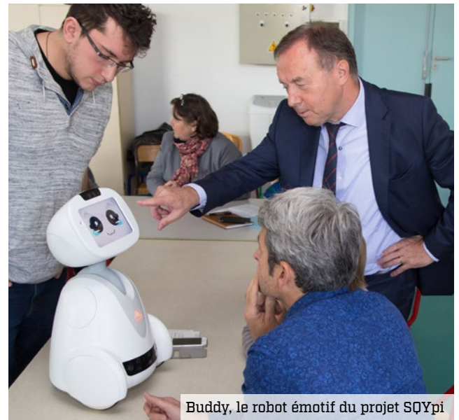
Buddy, le robot émotif du projet SQYpi