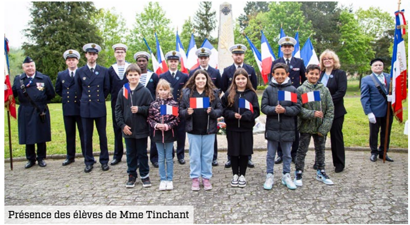
Présence des élèves de Mme Tinchant

Militaires, équipe pédagogique et élèves ont échangé sur le lien Armée-Nation.