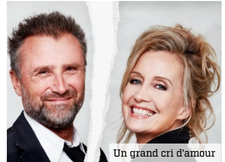
Un grand cri d'amour

« Notre objectif est simple : vous permettre de vous cultiver et vous divertir avec des spectacles mettant en vedette les meilleurs artistes du moment à un tarif attractif et à deux pas de chez vous ! », précise votre élu. Pour réserver vos spectacles au meilleur prix, votre théâtre municipal vous propose plusieurs abonnements avantageux comme le Pass Prisme (pour 10 €, il donne droit au tarif Pass Prisme sur tous les spectacles de la saison, soit 30 à 50 % de réduction) et le tarif jeunes (réservé aux moins de 25 ans et compatibles avec les dispositifs Pass Culture et Pass +). Votre salle propose également de devenir abonné relais pour bénéficier d'avantages exclusifs. Retrouvez toutes les modalités sur leprisme.elancourt.fr et gardez-les à portée de main grâce à votre document de saison, déjà en ligne, et bientôt dans votre boîte aux lettres !