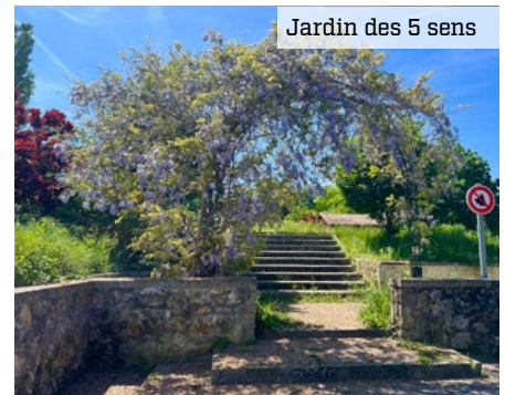
Jardin des 5 sens

Si vous voulez qu'ils donnent des fruits, respectez-les ! Par exemple, ne prélevez les fruits que s'ils se détachent seuls (signe qu'ils sont mûrs) et ne tirez ou