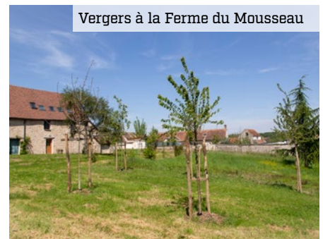
Vergers à la Ferme du Mousseau

n'arrachez pas les branches. À proximité de ces sites, pour vous relaxer (ou déguster votre cueillette), de nouveaux bancs ont été choisis et installés par la Ville, sur l'impulsion d'un autre budget alloué aux propositions des citoyens. Des racks à vélo colorés ont aussi été installés devant tous les groupes scolaires.