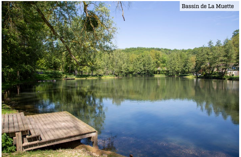
Bassin de La Muette

Autre projet nature en cœur de Village, les travaux ont débuté au Jardin des 5 sens. La phase de terrassement est en cours, ainsi que la rénovation de l'ancien préau. Le square a été repensé, sur l'impulsion d'un projet choisi par les Élancourtois, pour accueillir un nouvel espace ludique dédié aux 0/5 ans. Le projet, conçu et financé par les services de la commune, a été distingué pour son exemplarité environnementale par l'Agence Nationale de l'Eau qui lui a octroyé une subvention de 194 000 €. En effet, 100 % des surfaces au sol récupèrent et canalisent le ruissellement des eaux de pluie afin que celles-ci viennent irriguer les plantations. Malin !