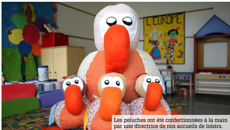
Les peluches ont été confectionnées à la main par une directrice de nos accueils de loisirs.

À la rentrée 2024-2025, la peluche Nounah, imaginée par le Centre académique d'aide aux écoles et aux établissements (CAAEE), déjà présente en classe, rejoindra les enfants de nos accueils de loisirs maternels et élémentaires. Cette peluche joviale, confectionnée par les mains expertes d'une directrice de nos accueils de loisirs, sera utilisée par les animateurs dans le cadre de la lutte contre le harcèlement. Ces derniers disposeront, en complément, de ressources fournies par le CAAEE : affiches, jeux, petites histoires ou encore activités pédagogiques mettant en scène Nounah. Ils pourront ainsi aborder des sujets comme la différence, le handicap, et travailler sur la gestion des émotions en s'appuyant sur le rapport affectif des enfants à ce petit personnage. « Le déploiement de Nounah dans nos accueils de loisirs repose sur un partenariat exemplaire