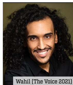
Wahil (The Voice 2021)

Venez nombreux, d'autres surprises viendront rythmer la soirée !