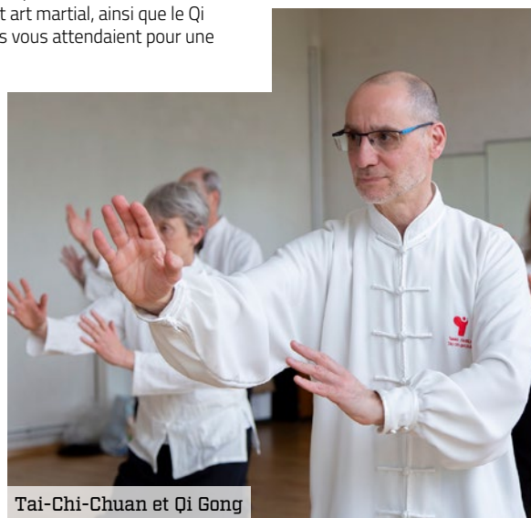
Tai-Chi-Chuan et Qi Gong