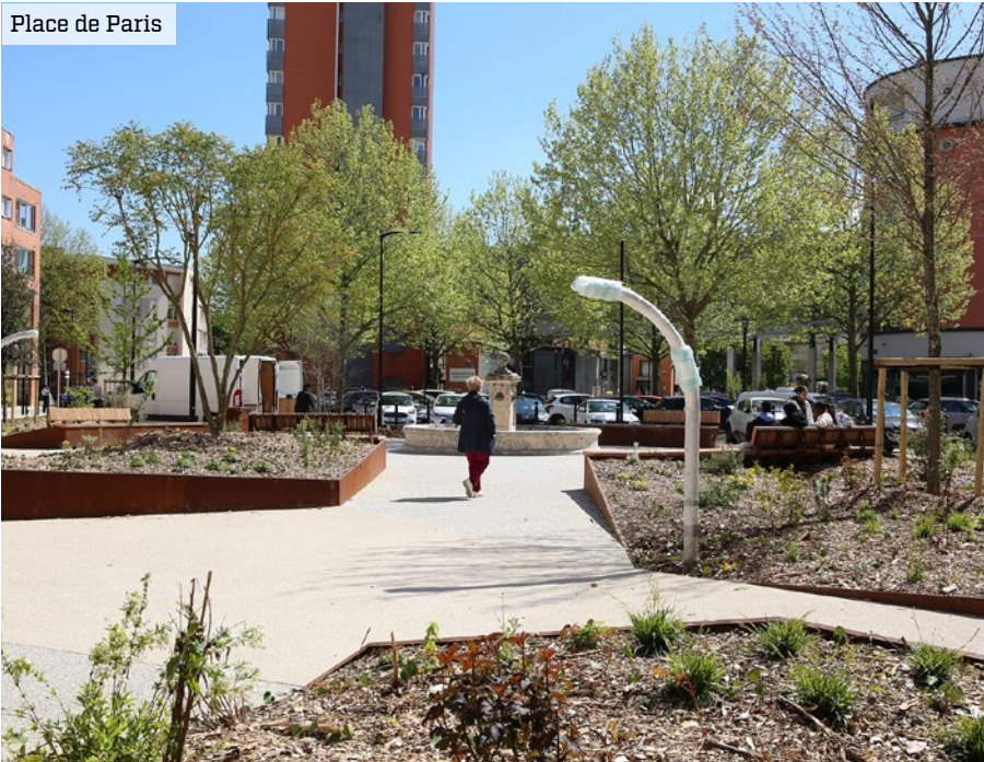
Place de Paris