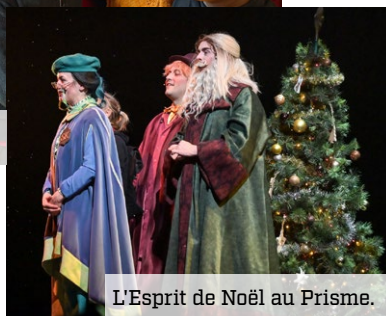
L'Esprit de Noël au Prisme.