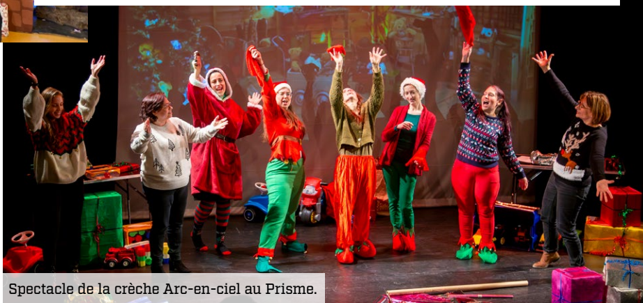
Spectacle de la crèche Arc-en-ciel au Prisme.

Les enfants ont participé à des animations festives sur le temps périscolaire, avec notamment l'ouverture des cadeaux et le traditionnel repas de Noël à la cantine ! Dans nos crèches, nos auxiliaires de puériculture ont fait preuve d'imagination et de créativité en préparant de magnifiques spectacles pour les tout-petits. Enfin, les familles garderont de merveilleux souvenirs du spectacle de l'Esprit de Noël, joué le 30 novembre sur la scène du Prisme !