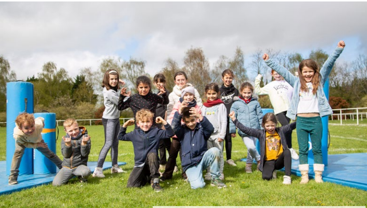
La semaine olympique pour 2 000 élèves !