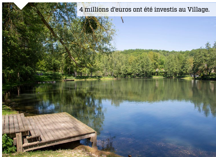
4 millions d'euros ont été investis au Village.

Les familles profitent d'une nouvelle aire de jeux, fraîchement finalisée, au Jardin des 5 sens. Le bassin de la Muette a aussi été complètement rénové en lien avec SQY. Les travaux se poursuivront en 2025 pour sécuriser la circulation dans ce quartier historique.