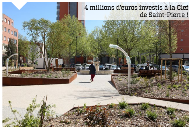
4 millions d'euros investis à la Clef de Saint-Pierre !

Un programme de travaux très ambitieux vient de s'achever pour apporter plus de nature en Ville et embellir le quartier. Ils se sont terminés par la rénovation des places de Paris et de Berlin.