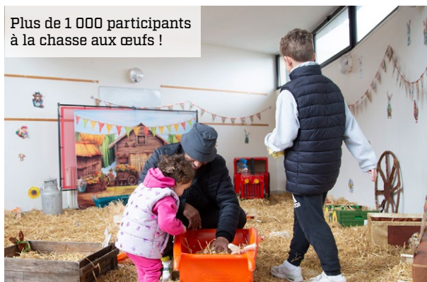
Plus de 1 000 participants à la chasse aux œufs !