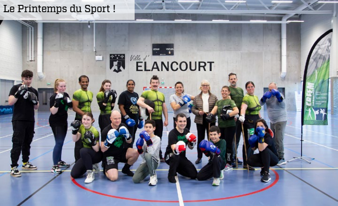
Le Printemps du Sport !

→ En 2024, vous avez bougé aux côtés de nos services et de nos associations ! Cette année exceptionnelle restera marquée par nos projets sportifs et le merveilleux souvenir des Jeux Olympiques sur la Colline !