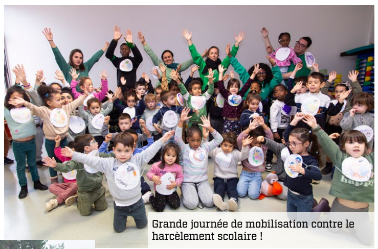
Grande journée de mobilisation contre le harcèlement scolaire !