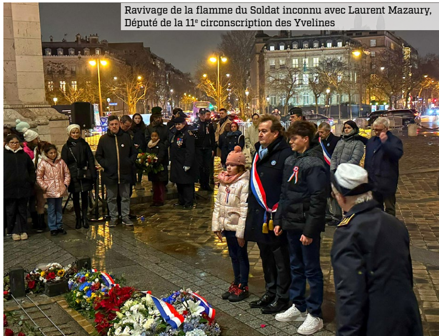
Ravivage de la flamme du Soldat inconnu avec Laurent Mazaury, Député de la 11 e circonscription des Yvelines

→ Le 10 décembre, des CM2 de la Nouvelle Amsterdam ont participé au ravivage de la flamme du Soldat inconnu sous l'Arc de Triomphe. Un acte patriotique qui s'inscrit dans une série d'actions citoyennes organisées en partenariat avec la Ville.