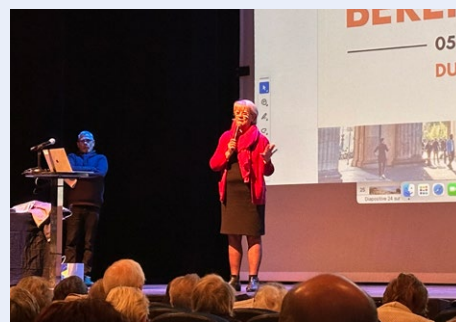
Présentation des voyages au Prisme, le 5 déc.