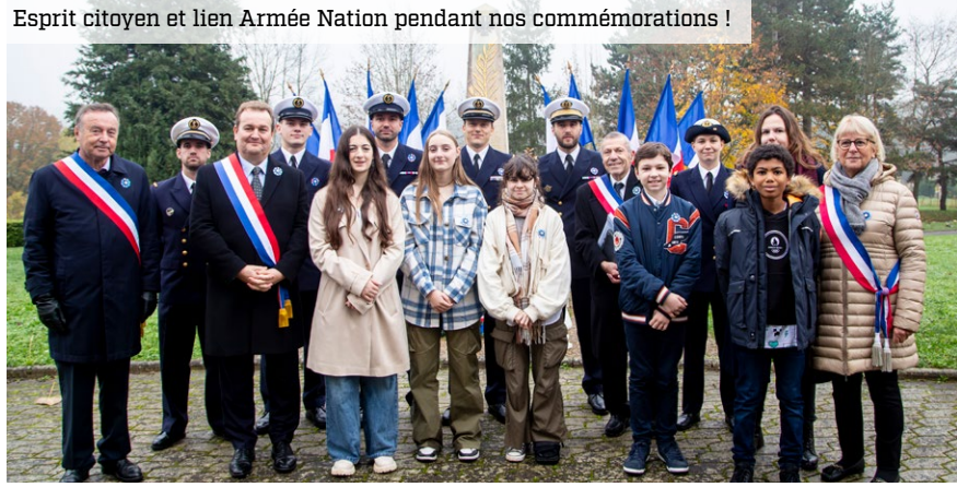
Esprit citoyen et lien Armée Nation pendant nos commémorations !