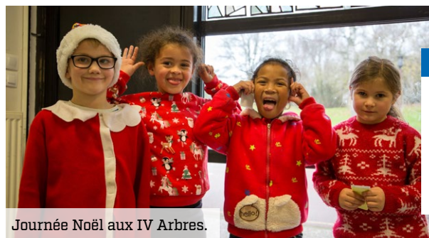
Journée Noël aux IV Arbres.