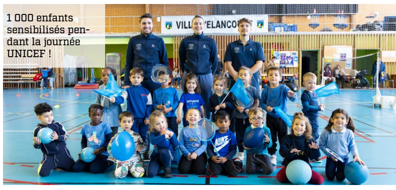
1 000 enfants sensibilisés pendant la journée UNICEF !