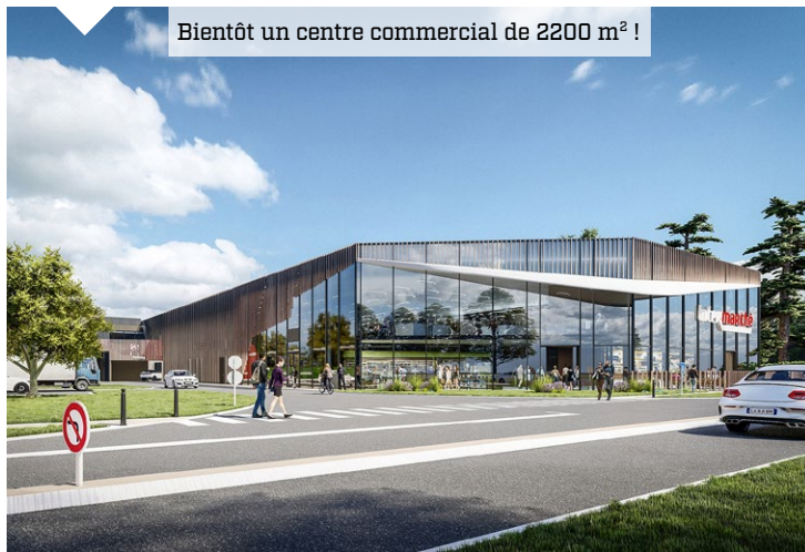
Bientôt un centre commercial de 2200 m 2 !

L'Hôtel de police de SQY est sorti de terre et ouvrira en mai 2025. Hyper connecté et innovant, il offrira à nos policiers nationaux, comme aux victimes, un cadre de travail et d'accueil performant. À deux pas, les travaux du magasin Intermarché sont lancés pour une ouverture prévue au dernier trimestre 2025 !