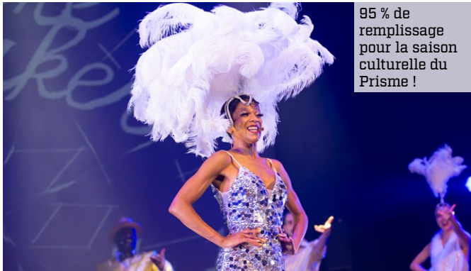
95 % de remplissage pour la saison culturelle du Prisme !

→ Sur la scène du Prisme, ou lors de nos plus grands rendez-vous, vous avez répondu présent ! Cette année, nous avons partagé beaucoup de beaux moments en famille !