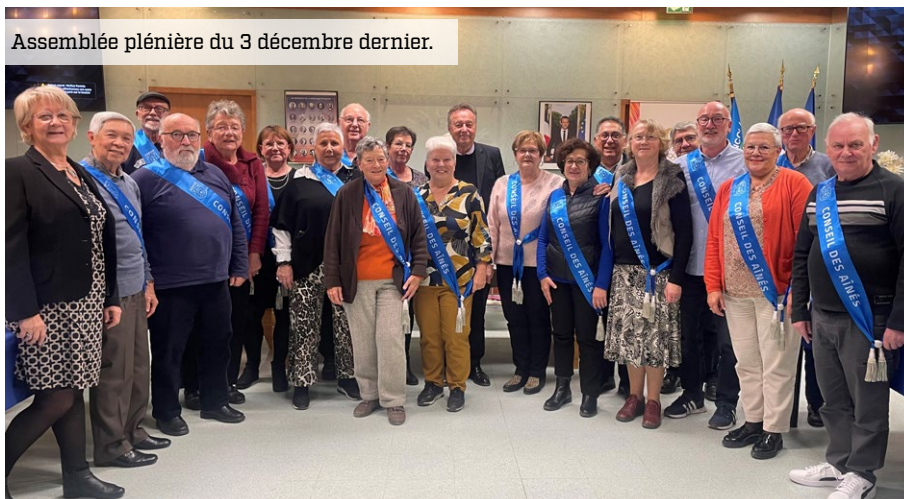
Assemblée plénière du 3 décembre dernier.

→ Ils se sont réunis le 3 décembre dernier pour présenter leur travail : les membres du Conseil des Aînés viennent d'achever la première année d'un mandat qui présage de beaux projets pour Élancourt.