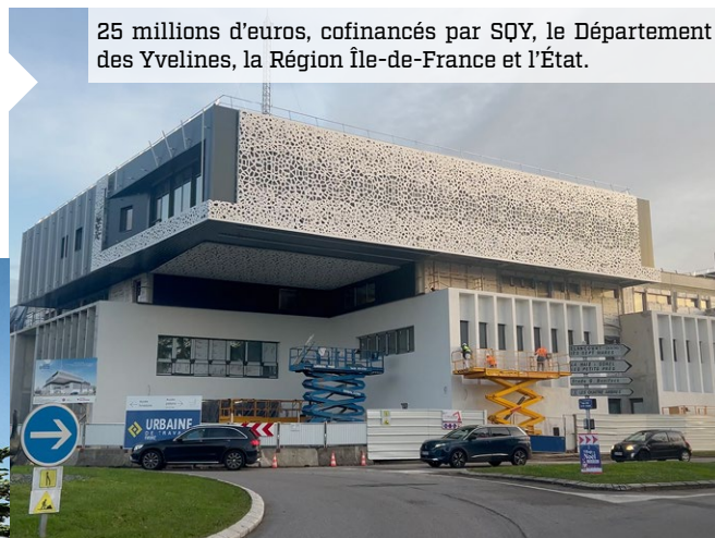
25 millions d'euros, cofinancés par SQY, le Département des Yvelines, la Région Île-de-France et l'État.