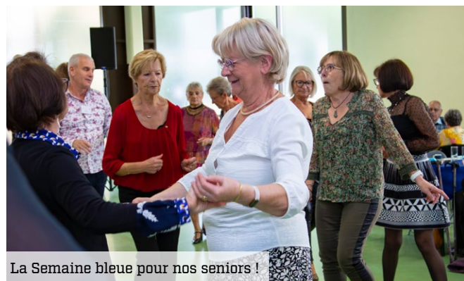
La Semaine bleue pour nos seniors !