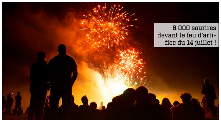
6 000 sourires devant le feu d'artifice du 14 juillet !