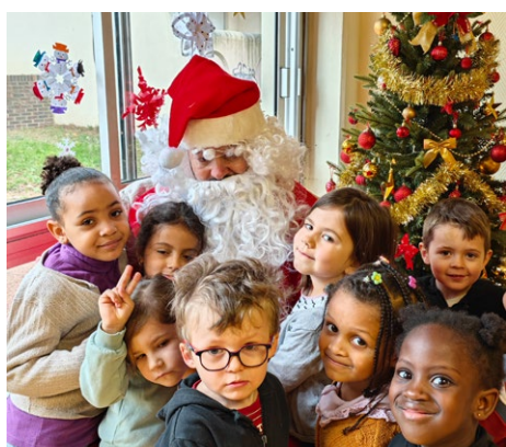
Visite spéciale à la Ruche !