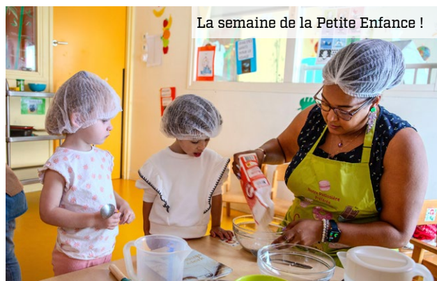
La semaine de la Petite Enfance !

→ La famille est une valeur forte à Élancourt ! En 2024, la commune a multiplié les événements à destination des enfants, jeunes, parents et seniors, avec la création de nouveaux rendez-vous et le retour de nos incontournables. Cette année a aussi été marquée par le renouveau de notre offre pour les jeunes, installés dans un nouveau lieu, et avec de nouvelles activités, des stages et des séjours. Enfin, nos commémorations et nos temps de sensibilisation autour des droits de l'enfant, du handicap ou encore de la lutte contre le harcèlement ont favorisé l'esprit citoyen chez nos plus jeunes !