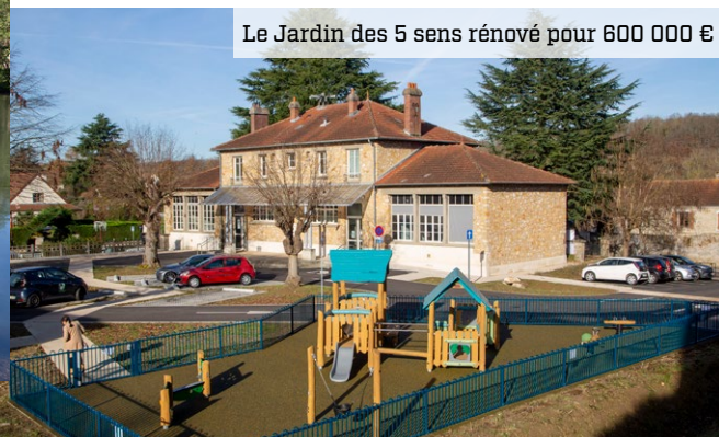
Le Jardin des 5 sens rénové pour 600 000 €

>> RETROUVEZ PLUS DE DÉTAILS SUR CES PROJETS SUR ELANCOURT.FR , DANS LA RUBRIQUE GRANDS PROJETS !