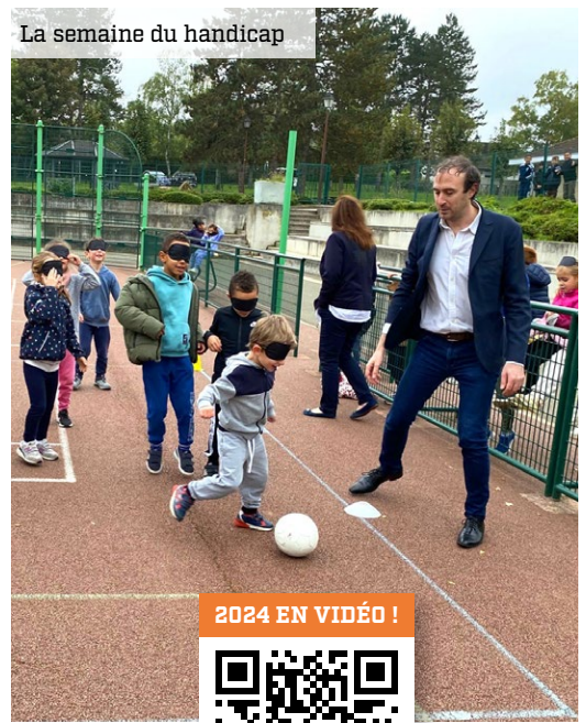
La semaine du handicap