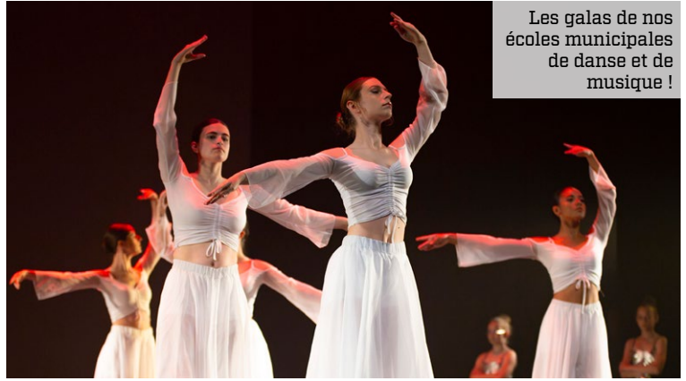
Les galas de nos écoles municipales de danse et de musique !