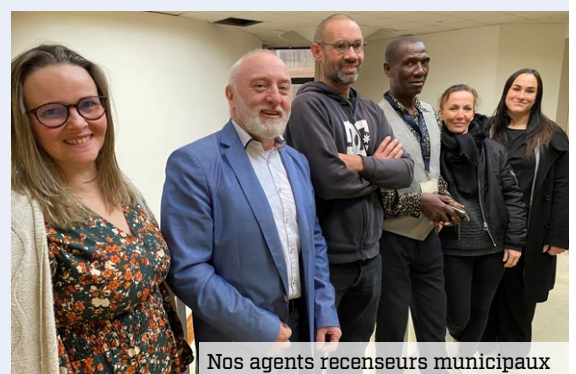
Nos agents recenseurs municipaux

Le recensement a lieu tous les ans à Élancourt, et cette année, il se tiendra du 16 janvier au 22 février 2025. Chaque année, un échantillon différent de la population est recensé ; si vous faites partie de la liste établie par l'INSEE pour 2025, une lettre sera déposée dans votre boîte aux lettres début janvier. Puis, un agent recenseur, recruté par la commune, vous fournira une notice d'information soit dans votre boîte aux lettres soit en mains propres. Suivez les instructions qui y sont indiquées pour vous faire recenser. Se faire recenser en ligne est plus simple et plus rapide, mais si vous le souhaitez, des questionnaires papier pourront vous être remis par l'agent recenseur. C'est simple et utile ! En effet, les résultats du recensement permettent à notre ville de disposer des ressources financières nécessaires à son fonctionnement et d'identifier les besoins en matière d'équipements, de commerces, de logements... Plus d'infos : le-recensement-et-moi.fr