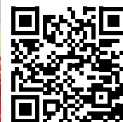
+ DE PHOTOS