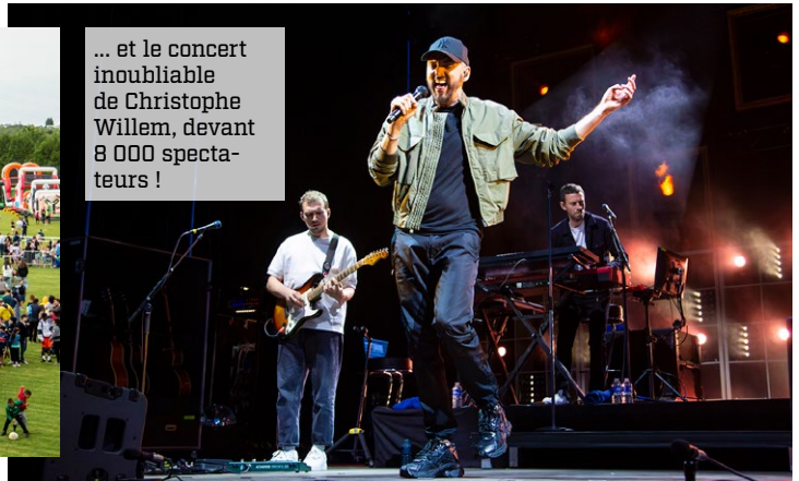
... et le concert inoubliable de Christophe Willem, devant 8 000 spectateurs !

Plus de 12 000 visiteurs et 750 exposants réunis pour la Fête d'Automne et la Braderie Paris 2024 !