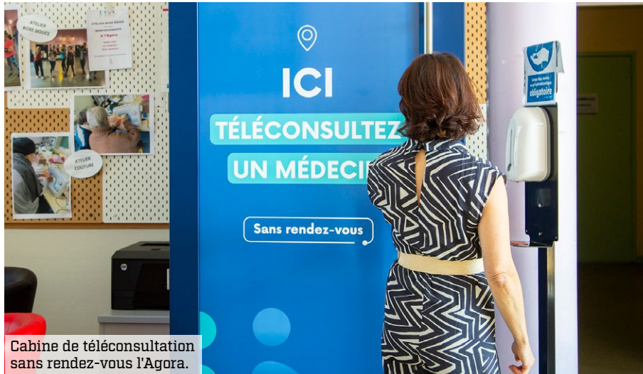
Cabine de téléconsultation sans rendez-vous l'Agora.

→ Une cabine de téléconsultation est installée depuis 2023 au centre social Agora, et une seconde a ouvert à la Pharmacie de la Mairie. Elles représentent une alternative simple et accessible pour consulter un médecin, sur les maux du quotidien.