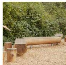
GRANDE DEMI POUTRE