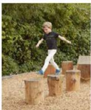
PAS DE GÉANT

VISUALISEZ LE PLAN ET LES TRACÉS DES PISTES AVEC DES PHOTOS D'AMBIANCE ICI