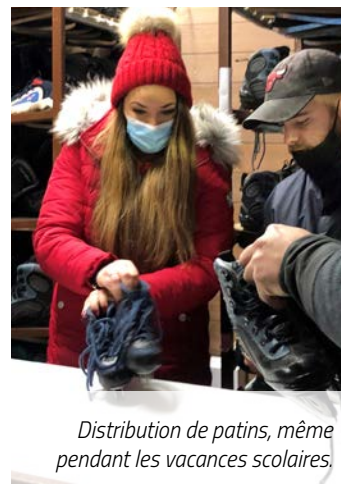
Distribution de patins, même pendant les vacances scolaires.