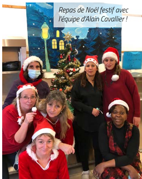
Repas de Noël festif avec l'équipe d'Alain Cavalier !