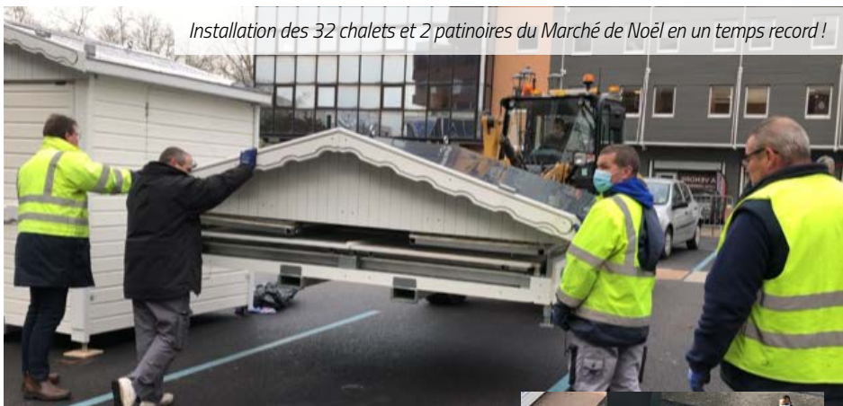
Installation des 32 chalets et 2 patinoires du Marché de Noël en un temps record !