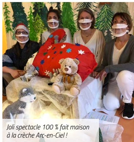
Joli spectacle 100 % fait maison à la crèche Arc-en-Ciel !