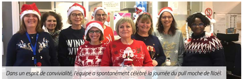
Dans un esprit de convivialité, l'équipe a spontanément célébré la journée du pull moche de Noël.