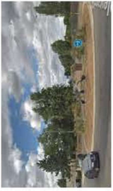
Rond-point du Pré-Yvelines