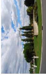
Rond-point Cassina de' Pecchi