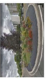
Rond-point des Droits de l'Homme et du Citoyen